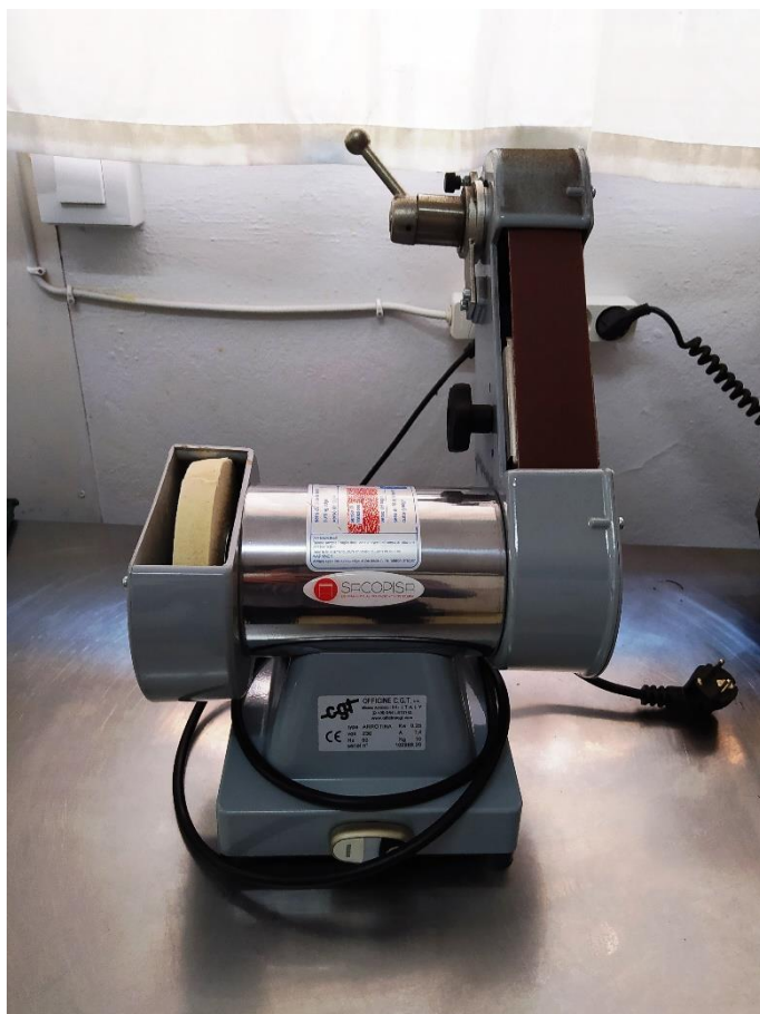
Asociacion Comarcal Pro-Personas con Discapacidad Psíquica "Virgen de Araceli" Expediente N°.: P1294-2020