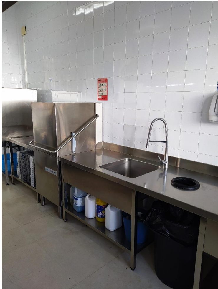
Asociacion Comarcal Pro-Personas con Discapacidad Psíquica "Virgen de Araceli" Expediente N°.: P1294-2020