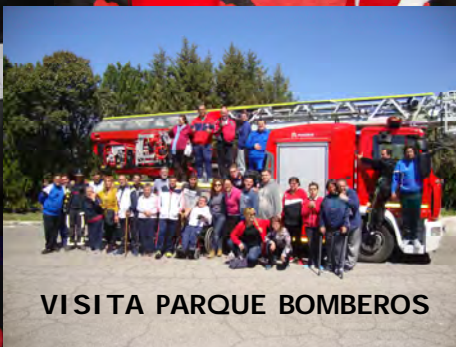
VISITA PARQUE BOMBEROS