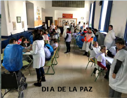
DIA DE LA PAZ